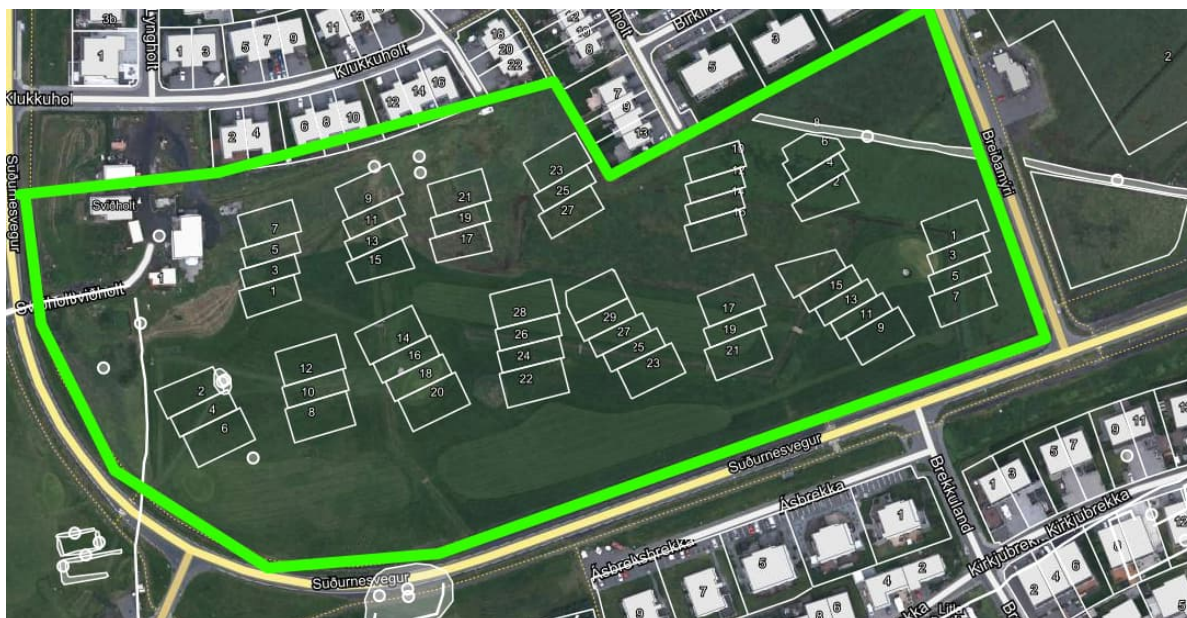
Fornleifar á framkvæmdasvæðinu (byggt á map.is/gardabaer ).

Einungis fáeinjar fornleifar eru innan svæðisins eða á mörkum þess. Rétt innan norðurmarkanna liggur forn gata, svokölluð Sviðholtsbrú. Hún hefur þó verið malarborin á seinni tímum þannig að í raun er einungis sjálfvægastæðið gamalt en það hefur nokkurt minjagildi sem slíkt. Gatan liggur ofan Sviðholtsbæjarins sem enn er í byggð. Samkvæmt heimildum hefur verið búið í Sviðholti að minnsta kosti frá því á 16. öld og er eldri bæjarhóll í norðvesturhorni túnsins, rétt utan skipulagsmarka eða við norðvesturhorn skipulagsreitsins. Hlaðnar traðir, Sviðholtstraðir, lágu norður að bænum og finnst svolítið brot af þeim á 5 m kafla sunnan við bæjarhólinn. Þær mynda þar skábraut upp á hlaðið, um 3 m á breidd og 0,5 m á hæð. Í brekku um 10 m suðvestur frá bæjarhólnum eru svo leifar garðhleðslu úr torfi og grjóti, farnar að renna sundur en ná um 0,4 m hæð. Garður hefur upphaflega verið hlaðinn kringum matjurtagarðinn Sameignargarð sem ábúendur í Sviðholti nýta enn að hluta. Hann er nú um 40 x 30 m á stærð. Bæði traðirnar og garðhleðslan eru á mörkum skipulagsreitsins en að hluta innan hans. Þessar minjar eru óverulegar en hafa þó gildi sem hluti af efnislegri sögu Sviðholts og þarf að gæta að þeim. Einhvers staðar í túninu suðvestan Sviðholts stóð þurrabúðin Krókur en hennar sér nú engin merki og hefur hún líklega lent undir Suðurnesvegi. Stór grjóthruga er að vísu í túninu á þessu svæði en sennilega hefur hún orðið til við hreinsun þegar túnin voru ræktuð fram.