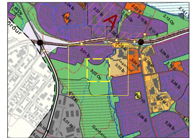
Hluti af Aðalskipulagi Garðabæjar 2016-2030

Deiliskipulag fyrir Bæjargarð var samþykkt í bæjarstjórn Garðabæjar 1. nóvember 2007.