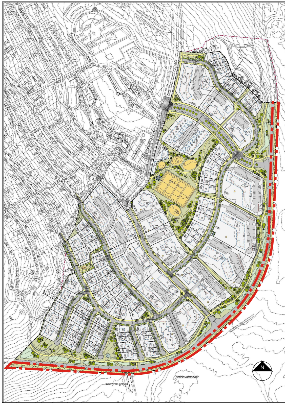
Gildandi deiliskipulag Urríðaholt austurhluta 1. áfangi samþykkt í bæjarstjórn 06.09.2018 mkv:1:4000