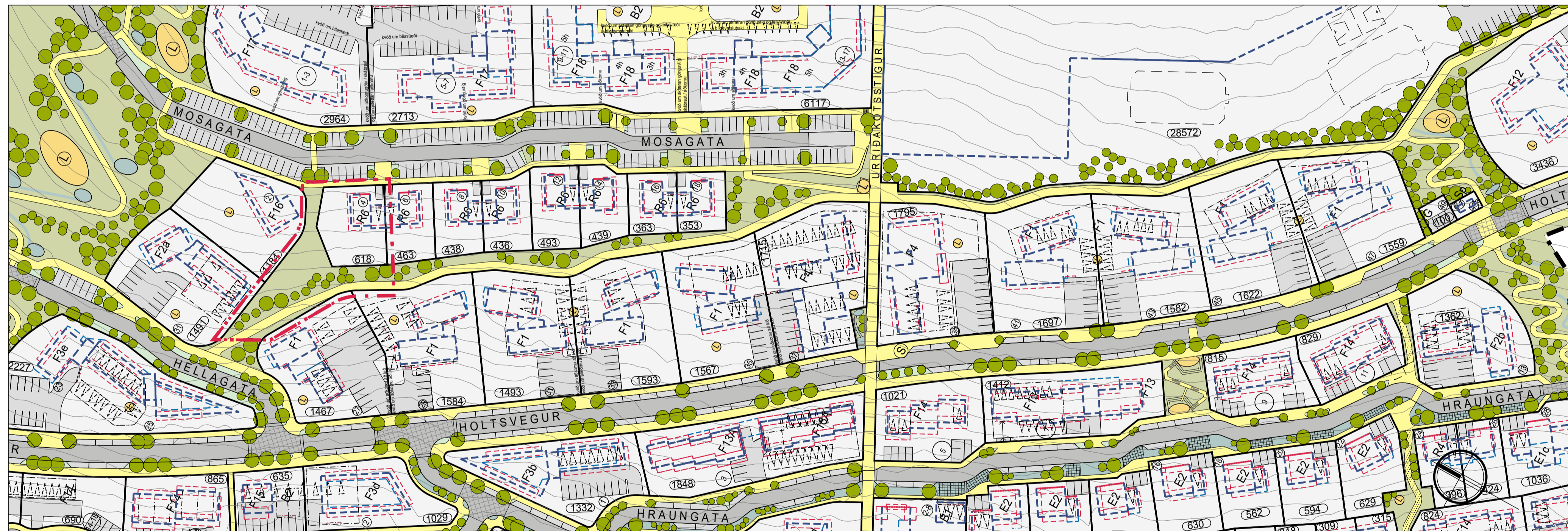
Tillaga að breytingu á deiliskipulagi mkv. 1:1000