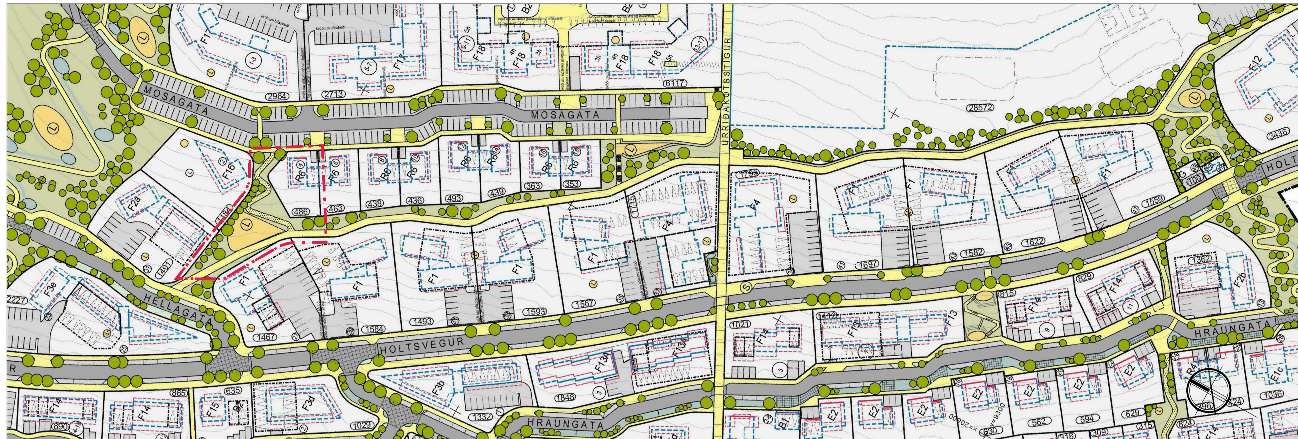
Gildandi deiliskipulag samþykkt í bæjarstjórn 16.08.2007 með síðari breytingum mkv. 1:1000