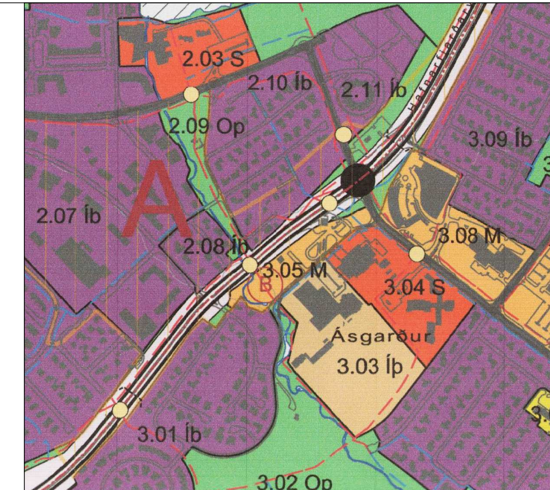
HLÚTI GILDANDI AÐALSKIPULAGS 2016-2030 1:7500