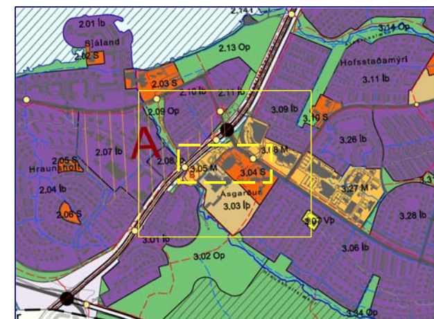
Hlíti af Aðalskipulagi Garðabæjar 2016-2030

Deiliskipulag fyrir Ásgarð, skóla- og íþróttasvæði, var samþykkt í bæjarstjórn Garðabæjar 1. nóvember 2001.