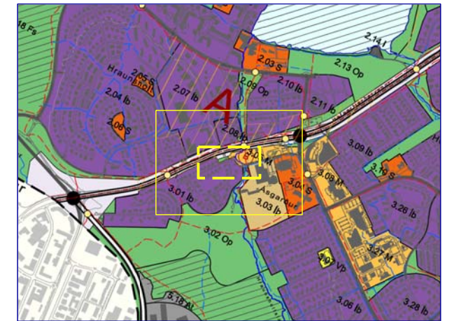
Hluti af Aðalskipulagi Garðabæjar 2016-2030