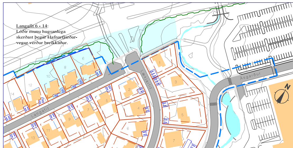
Eftir breytingu 1:2000