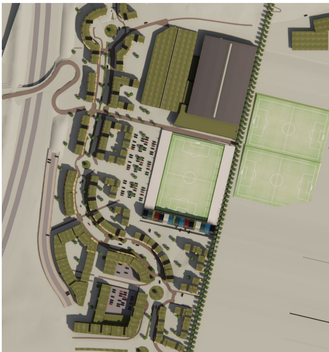
Mynd 1 skuggavarp 20.06. kl 10:00

Gerð var skoðun á skuggavarpri fyrir deiliskipulagstillögu að Vetrarmýri miðsvæði. Við skoðun voru valdir tveir dagar ársins; 20. júní og 20. september, og valin hádegissól kl. 13.00 og sólarstaða þremur tímum fyrir og 3 tímum eftir þ.e. kl 10:00 og 16.00.