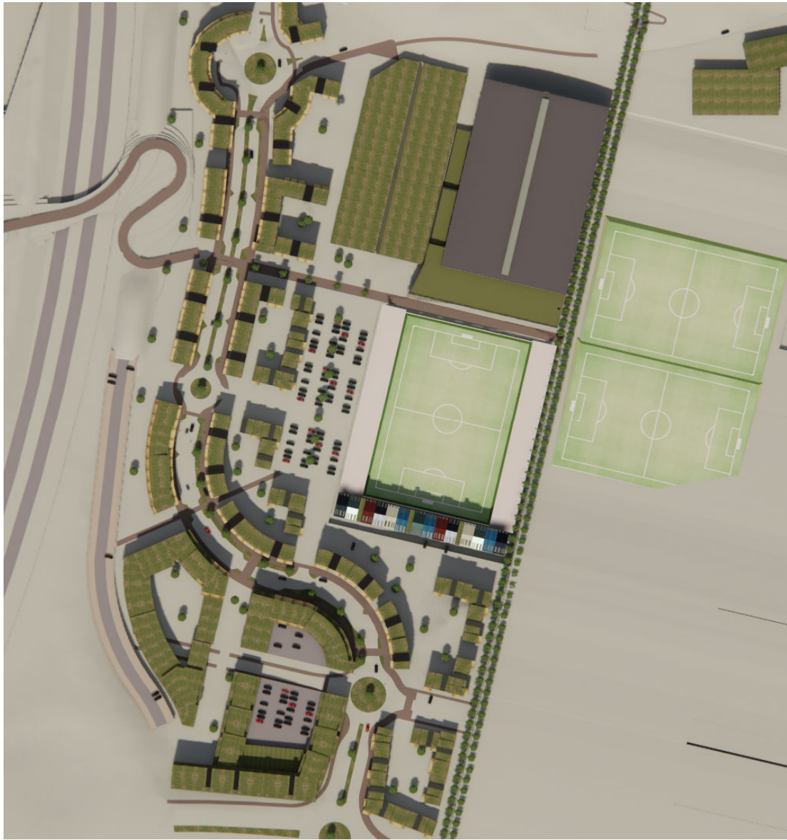
Mynd 2 skuggavarp 20.06. kl 13:00