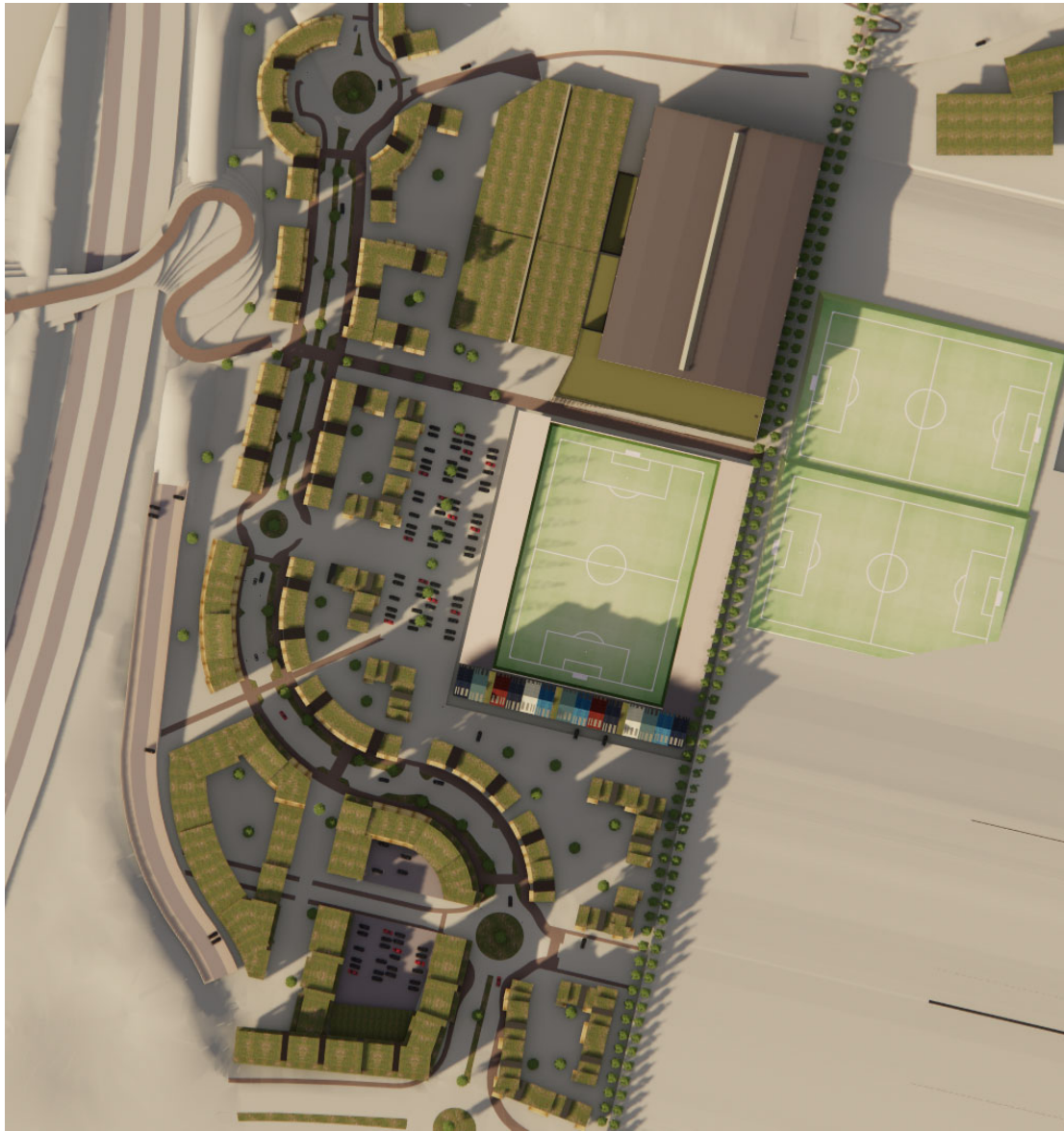
Mynd 6 skuggavarp 20.09. kl 16:00