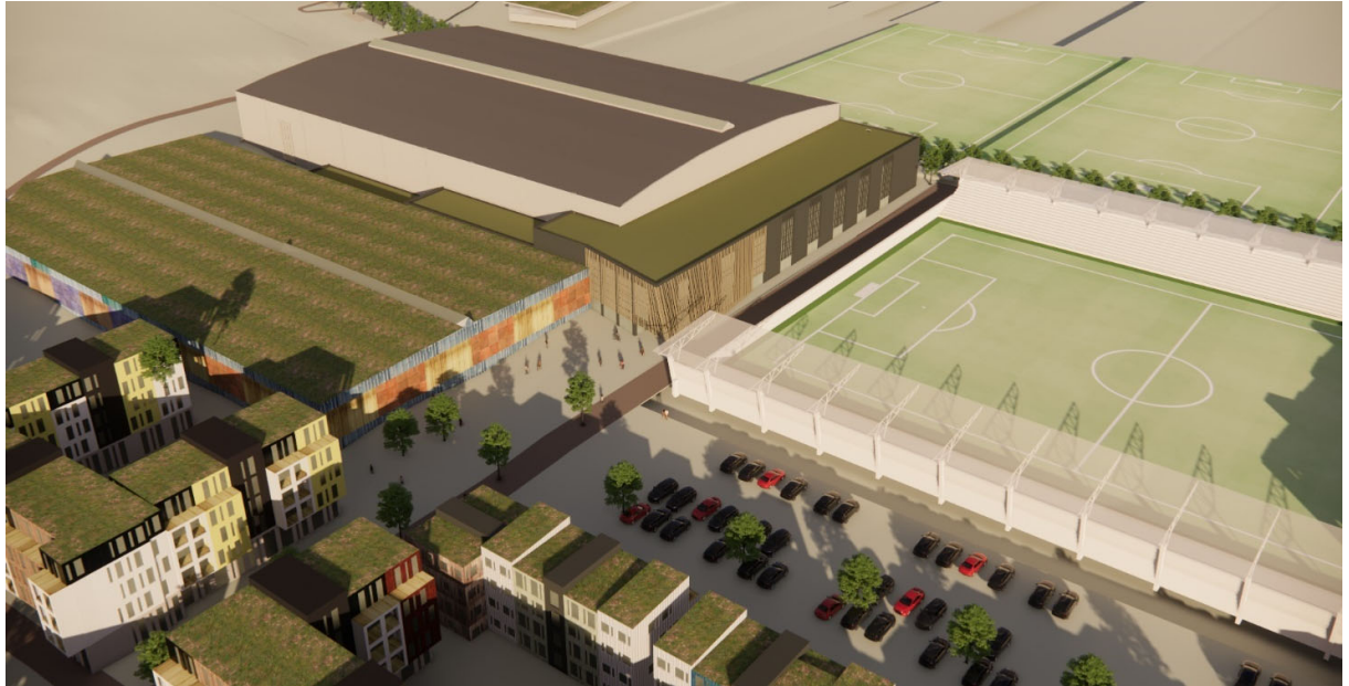
Mynd 7 skuggavarp 20.09. kl 16:00, aðaltorgið við íþróttasvæðið

Á ofangreindum myndum sést að skuggavarp bygginga er þess eðlis að stór hluti allra húsagarða nýtur sólar mestan hluta dags um miðsumar og allir garðar fá sól hluta úr degi á jafndægum. Aðaltorgið við íþróttasvæðið er mjög sólríkt og nýtur sólar allan daginn fram yfir jafndægur. Vetrarbrautin nýtur þess að liggja að meginhluta frá suðri til norðurs og fær því á flestum stöðum sól einhvern hluta dags.