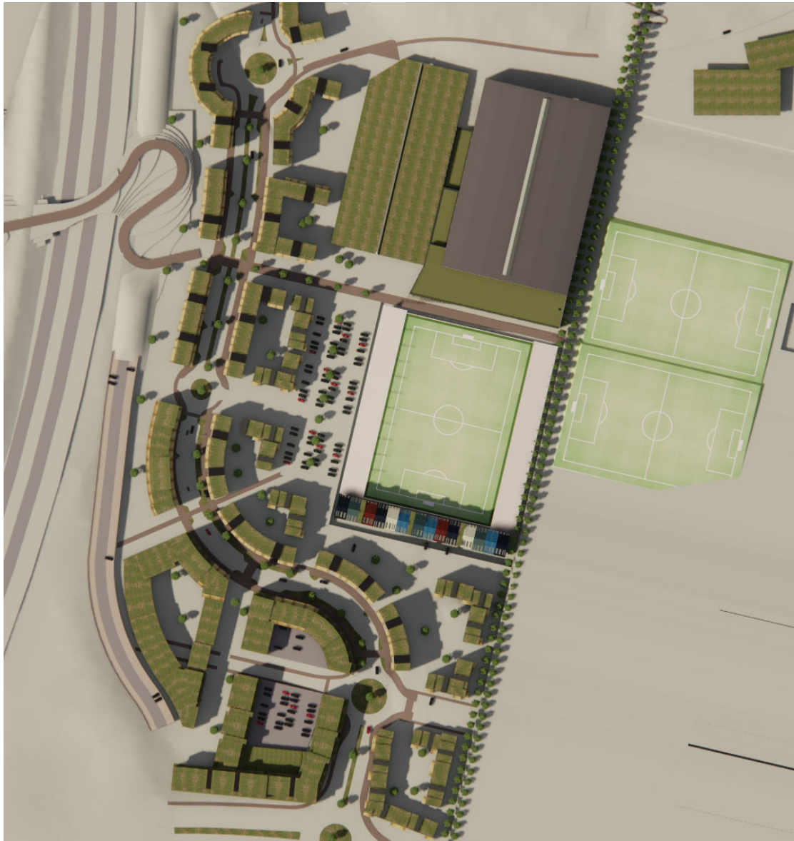
Mynd 3 skuggavarp 20.06. kl 16:00