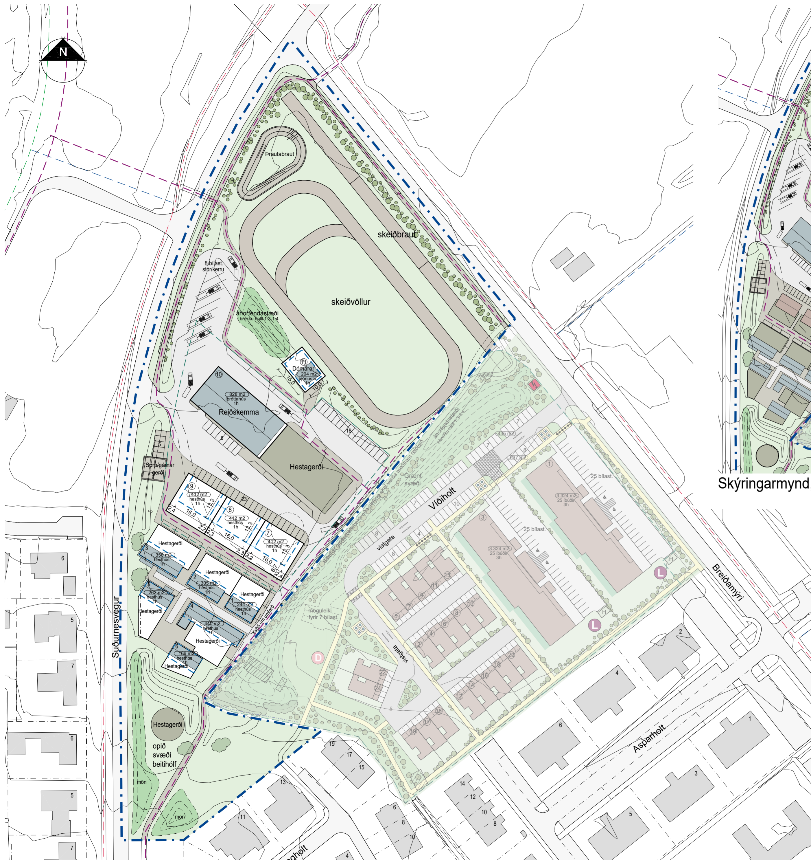
Deiliskipulagstillaga mkv. 1:1000