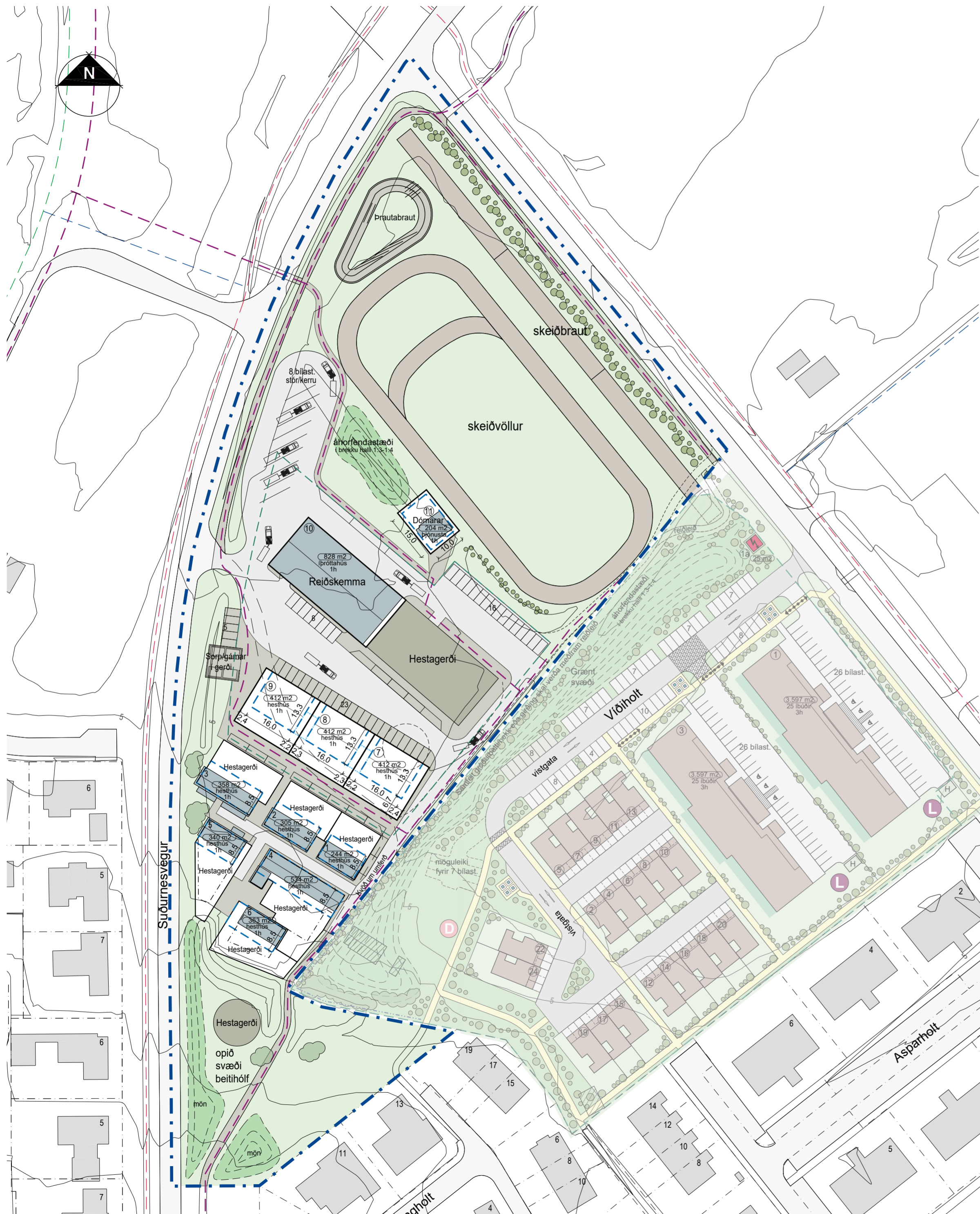
Deiliskipulagstillaga mkv. 1:1000