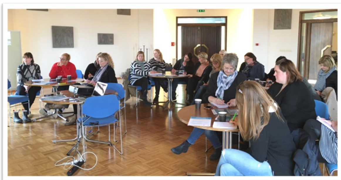
Mynd 2 Velferðarteymi leikskóla taka þátt í hugmyndavinnu fyrir námskeið B