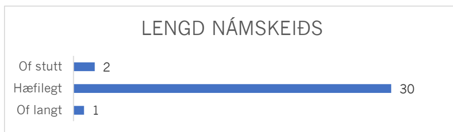
Mynd 5 Flestir voru ánægðir með lengd námskeiðs A.

Mikil ánægja var með námskeiðið og fannst 72,7% efnistökin vera mjög góð og 27,3% þátttakenda fannst efnistökin vera góð. 100% ánægja var með námskeiðið samkvæmt könnuninni. Sama svarhlutfall kom fram þegar spurt var um hvernig fyrirlesararnir stóðu sig.